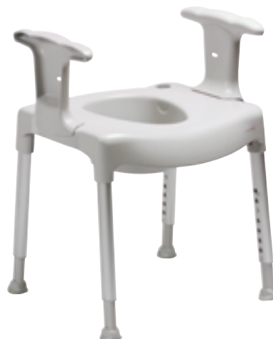
Modèle réglable en hauteur

Plusieurs hauteurs sont en général disponibles. Le choix du modèle et de la hauteur dépendra de vos besoins et capacités, nous vous conseillons vivement de réaliser des essais de matériel avant d'en faire une acquisition définitive.