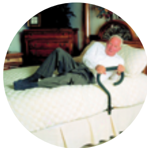
Barre d'appui glissée sous le matelas

Une fois assis au bord du lit, des barres d'appui spécifiquement conçues vous offriront un soutien supplémentaire pour vous aider. Celles-ci se fixent au sommier ou se glissent sous le matelas. Ici aussi le choix dépendra de vos besoins et habitudes.