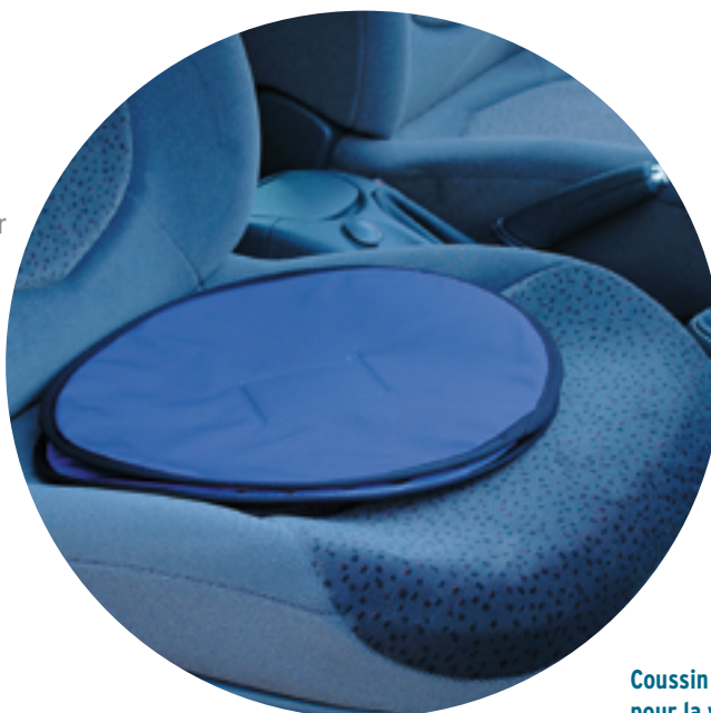
Coussin pivotant pour la voiture

Placé sur le siège même, il permet de tourner plus facilement le haut du corps, avant de pouvoir se redresser.