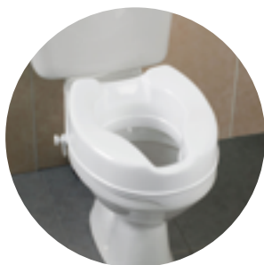
Rehausseur de WC amovible