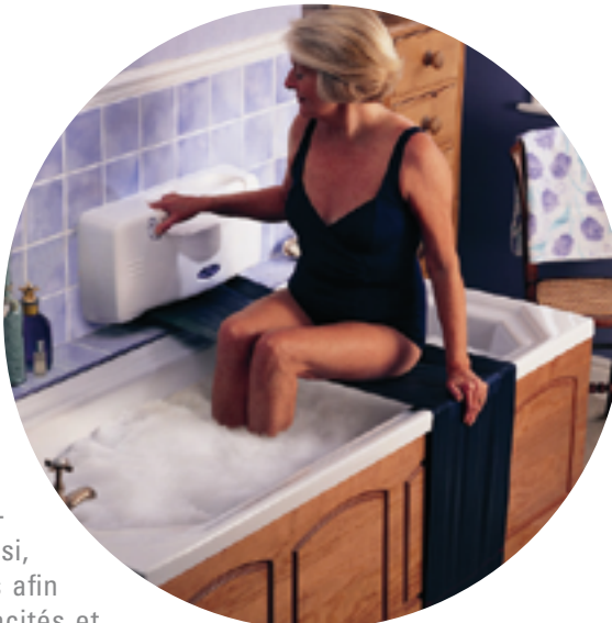
Lift bain gonflable

Plus coûteux mais très facile à utiliser, le lift de bain permet, grâce à une commande électrique, de faire descendre et monter le siège dans la baignoire. Il fonctionne en toute sécurité sur batterie. Certains systèmes gonflables ou fonctionnant sur le principe d'une toile qui se tend et se détend présentent un encombrement minime dans la baignoire. Ici aussi, des tests de matériel sont indispensables afin de vous assurer qu'il s'adapte à vos capacités et afin de sélectionner le modèle qui répondra le mieux à vos besoins et s'adaptera à votre baignoire.