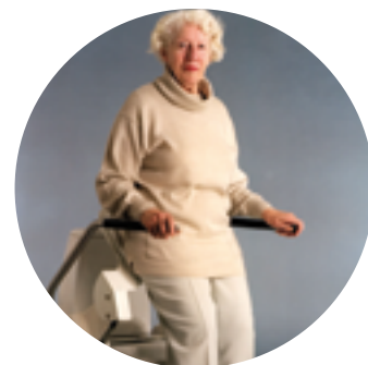
Système releveur électrique