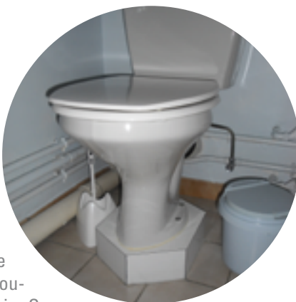
Socle en maçonnerie

Cette solution présente l'avantage d'être économique, discrète, esthétique et hygiénique. Contactez votre plombier pour obtenir un devis concernant ce type d'aménagement.