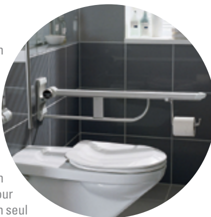
Barres de traction à fixation murale

Lorsqu'on rehausse son WC, de quelque façon que ce soit, l'installation de barres d'appui ou de traction, rabattables ou non, à fixations murales ou au sol, s'avère indispensable. Celles-ci permettent de trouver un point d'appui sécurisant. L'emplacement de ces barres devra être déterminé en situation concrète pour répondre au mieux à vos besoins. Cherchez-vous vos appuis loin devant ou plutôt sur le côté, façon "accoudoirs"? Utilisez-vous vos deux mains pour vous aider ou vous appuyez-vous seulement d'un seul côté? Une réflexion préalable est indispensable pour éviter un placement inefficace.