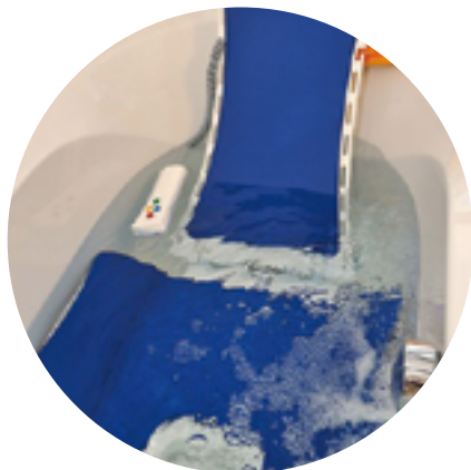
Siège élévateur de bain